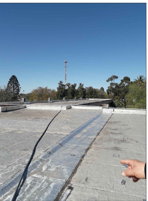
ABASTECIMIENTO A TANQUE EXISTENTE.