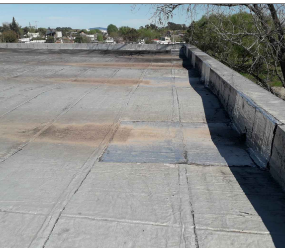
SECTOR A INTERVENIR